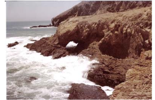
Península del Vizcaíno, B.C.

Los océanos tienen la clave de cómo trabaja la Tierra: