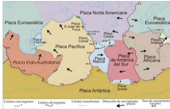
Modificado de http://wps.prenhall.com/esmthurman_essofocean_8

notables del relieve submarino: (a) límites divergentes: dorsales oceánicas, (b) límites convergentes: fosas oceánicas (“trincheras”) y (c) límites transformes: fallas transformantes o de deslizamiento lateral (ej. Falla de San Andrés).